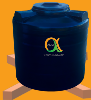
Base en cruz