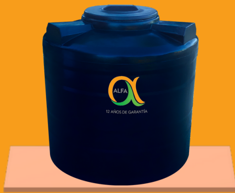
Base de madera